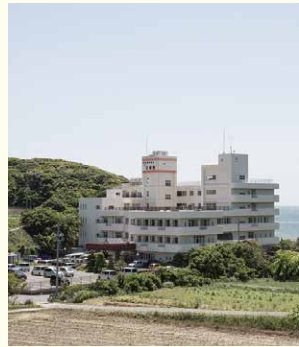
おうじゅえん ほうじんほんぶ 王寿園(法人本部)

年齢が高くなると、体や心の状態が不安定になることがあります。そんな生活のしづらさを抱えた高齢者とその家族をサポートすることが私たちの仕事です。介護士、介護支援専門員、生活相談員、看護師、調理師などさまざまな職員が手を取り合い、一人ひとりに合うサポートをします。施設でも自宅のような感覚で過ごせるよう、高齢者の生活リズムや能力を大切にしながら手伝いをしています。