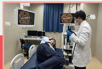
い 胃カメラや だいちょう 大腸カメラ

びょういん いりょう 病院には、たくさんの医療に かんれん しよくぎょう 関連する職業があります。