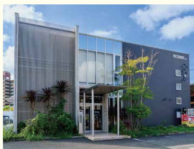
株式会社プライズメント本社

商品やサービスを提供するお店や企業に代わり、広告を使ってその魅力を多くの人に伝えるのが私たちの仕事です。広告にはフリーペーパーやチラシ、SNSなどの「媒体」があり、お客さまの要望に沿った媒体を使って、効率的に伝えたい人たちへ情報を発信します。また、広告を通して暮らしを豊かにすることを目指しています。