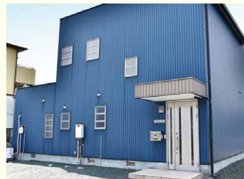
中西経営会計事務所

税理士は、会社の代わりに税金に関する難しい手続きや申告を行う専門家です。また、給与計算のサポートをしたり、会社のお金の流れや経営状況を整理してアドバイスも行います。さらに、これから会社やお店を始める人(開業する人)のサポートもしています。