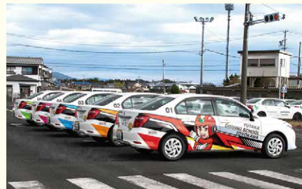
ユタカファイブの新型教習車

自動車の運転免許を取得するために通学している教習生に、運転の仕方を教える技能教習や、教本に沿ってルールなどを教える学科教習、運転の試験である技能検定などを行って、事故を起こさない安全運転ができる運転手を育てています。70歳以上の高齢者への講習や、交通安全教室・企業交通安全講習の開催、受付業務などの仕事もあります。