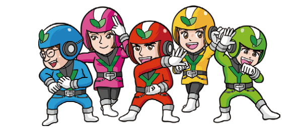
ユタカ豊川自動車学校イメージキャラクター「ユタカファイブ」

地域の交通事故ゼロを目指して、幼児や小中高生には自転車、大人には自動車を中心にさまざまな教室や講習を開催しています。