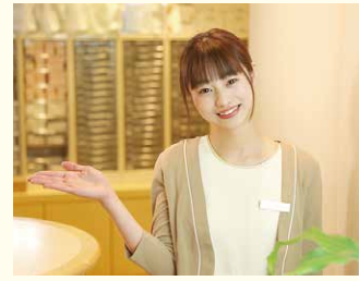
接客で日本一を目指す!

コンタクトレンズ専門店「HIROCON」の国内5店舗、海外(シンガポール)3店舗を運営しています。2018年豊川に業界初のコンタクトレンズ・ドライブスルーをオープンしました。「快適な視力生活」をサポートし、お客さまへのおもてなしの心を持って、時代に合わせたサービスを展開しています。