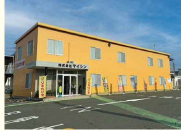
かぶしがいしゃ 株式会社マイシン

お客様から商品をあずかり、指定された場所へ安全安心に届ける運送会社です。遠くの家や店へ運ぶ長距離運送や、近くの地域を回って集荷・配送する周辺地域配送便などがあります。配送しているものは日用品や家電、食品などさまざまです。全てがみなさんの生活や社会を守るための大切な商品です。そのため、安全に運ぶことが重要になります。