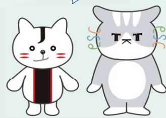
ジェイにゃん テクニャン ジェイテクト 公式マスコットキャラクター