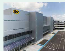
ヤマト運輸の倉庫 建物の外壁