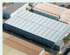
日鉄物産の工場 建物の屋根