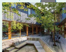
ほしの星野リゾート 軽井沢 建物の外壁