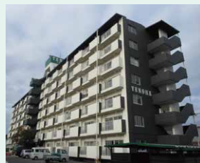
しゅうこうじゆうたく 集合住宅