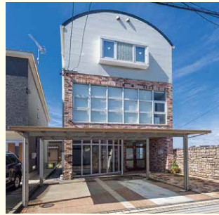
ひつよう しごと 必要な仕事です。

お客様の希望に合わせて、建物を塗装するのが私たちの仕事です。色を塗ることで見た目が美しくなるのはもちろん、建物が劣化するのを防ぐこともできます。時間の経過とともに塗装がはげてきてしまったら、塗り直すこともしています。その他、水漏れを防ぐ防水工事など、建物の状態に合わせてさまざまな施工をします。気持ちの良い状態で、建物を長く使い続けるために必要な仕事です。