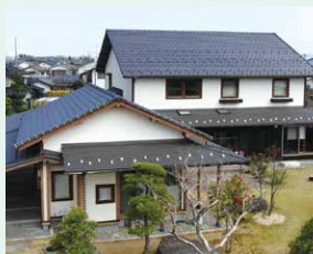
いつけん や 一軒家

うち がっこう みせ はし み まわ おお たてもの とそ お家や学校、お店、橋など、身の回りにある多くの建物を塗装しています。