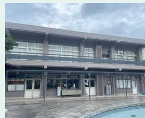
がっこう たいいくかん 学校・体育館